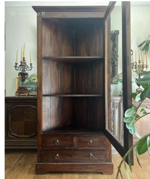
2 pav. Būsimos T. Grotthusso laboratorijos Žiemgalos muziejuje baldai.