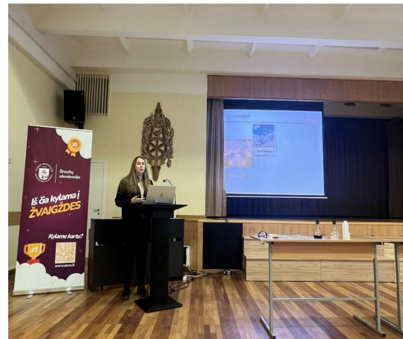
3 pav. Teodoro Grotuso gamtos mokslų eksperimentų konkurso Romuvos gimnazijoje akimirkos